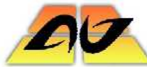
آذین جام سمنان